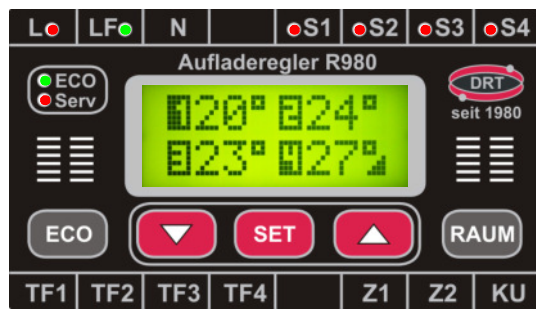
Aufladeregler R980-4 /-3 /-2 /-1